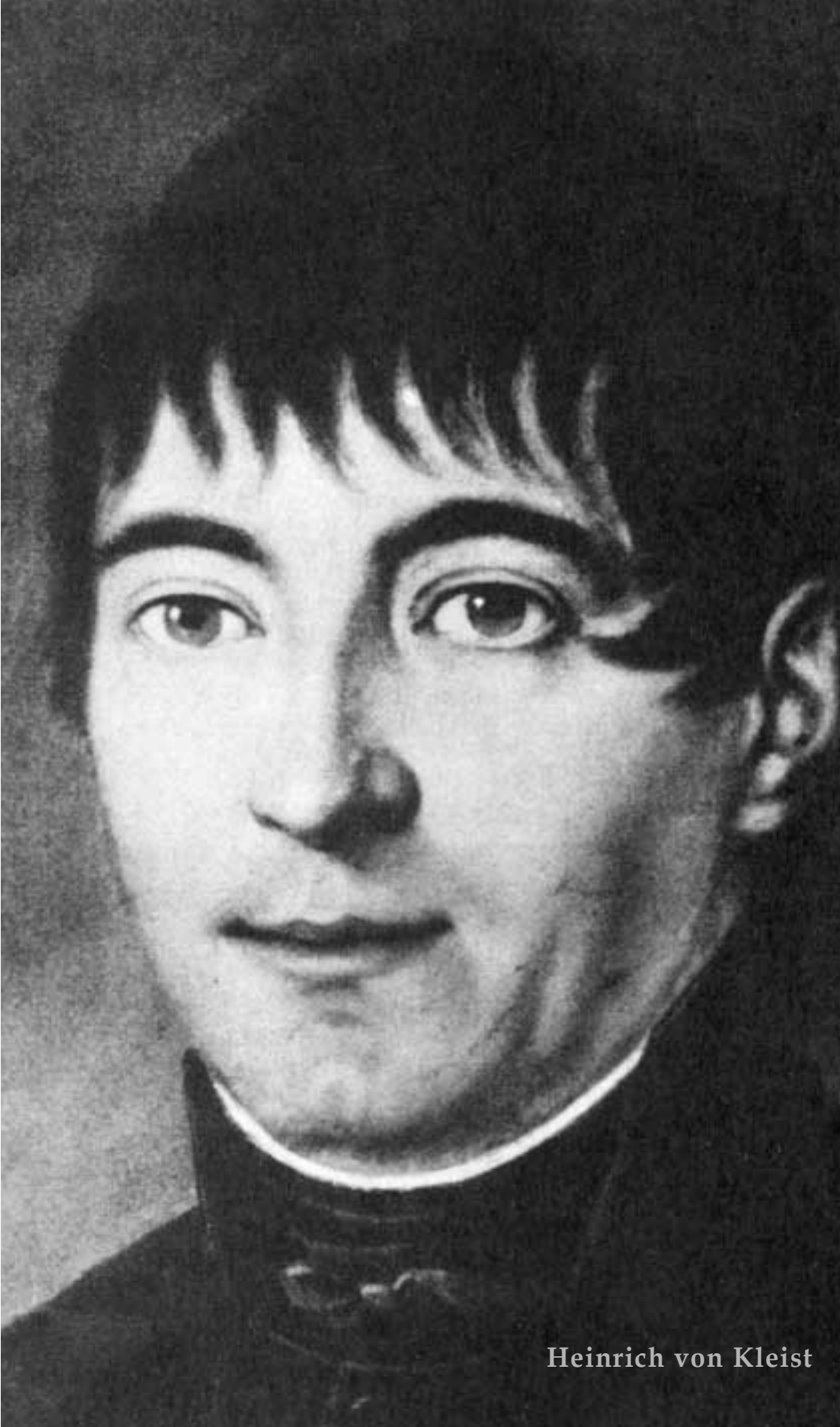
Heinrich von Kleist